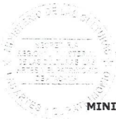
JUAN PEDRO PALTA ARAYA SECRETARIO REGIONAL MINISTERIAL (S) MINISTERIO DE LAS CULTURAS, LAS ARTES Y EL PATRIMONIO REGIÓN DE ATACAMA